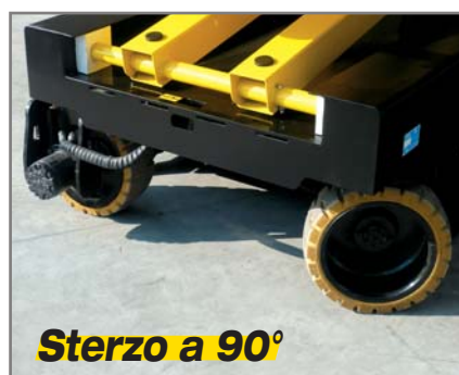
Sterzo a 90°